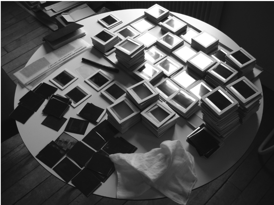
Pierre Leguillon, La table de montage du Diaporama (vestiaire) , 2006